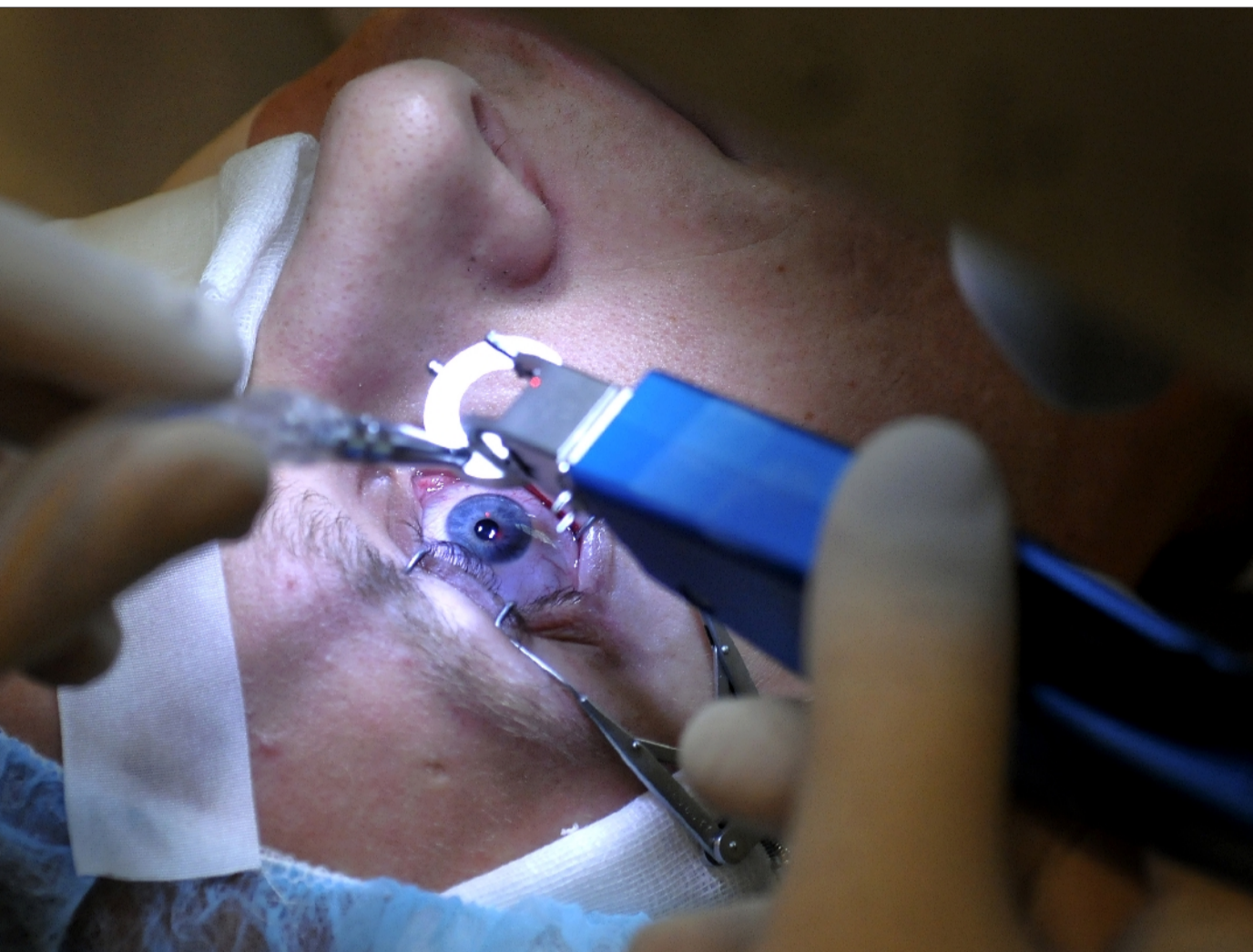
Inden laserbehandlingen bliver det yderste tynde lag celler løsnet, så strålen kan rettes mod den underliggende del af hornhinden.