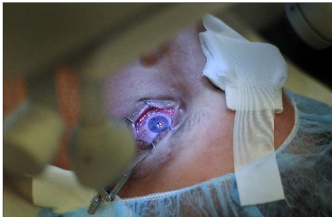
Laseren arbejder i få sekunder med stor efterfølgende virkning.