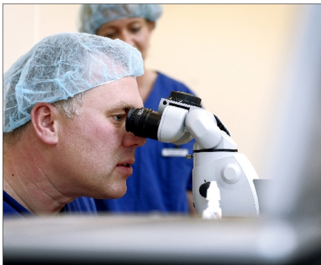
Der hersker stor koncentration under selve behandlingen, for la- serkirurgien foregår med uhyre præcision.